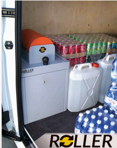
LA CASSAFORTE AD INTRODUZIONE SENZA CHIAVE PROGETTATA PER IL VENDING THE SAFE-BOX WITH THE KEYLESS INTRODUCTION SYSTEM